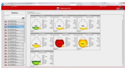
Ansicht Web Browser PC und Tablet

Optavias Head Office kann Lizenzen für bis zu 100 Stationen und Lizenzen für bis zu 200 PetroLine ATG Benutzer verwalten. Mehr Lizenzen sind auf Anfrage möglich.